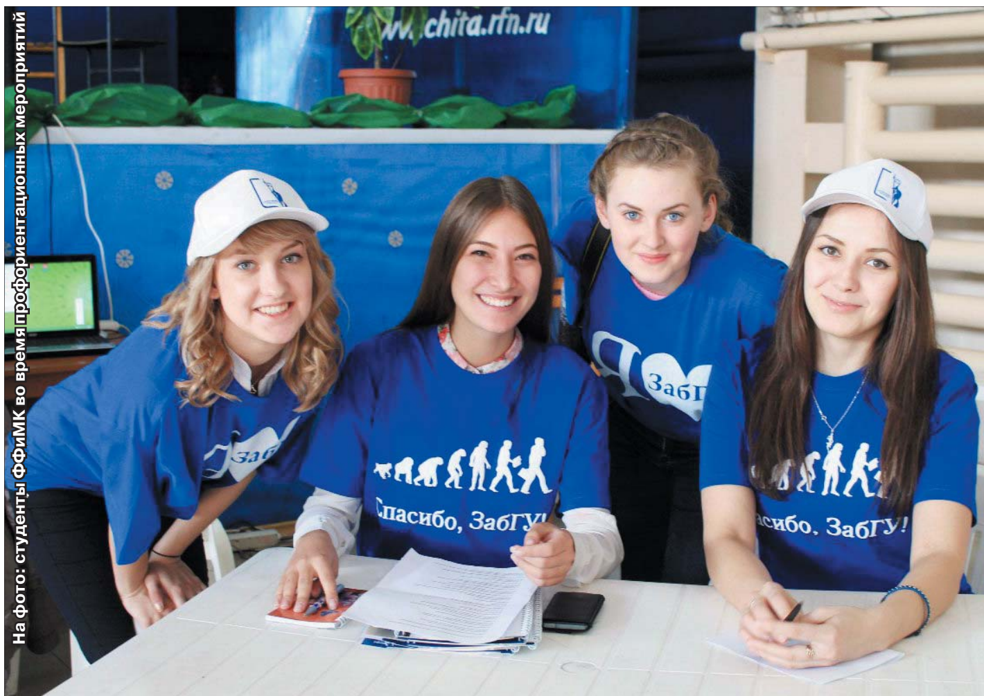
На фото: студентки ФФИМК во время профориентационных мероприятий