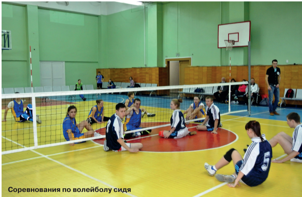
Соревнования по волейболу сидя