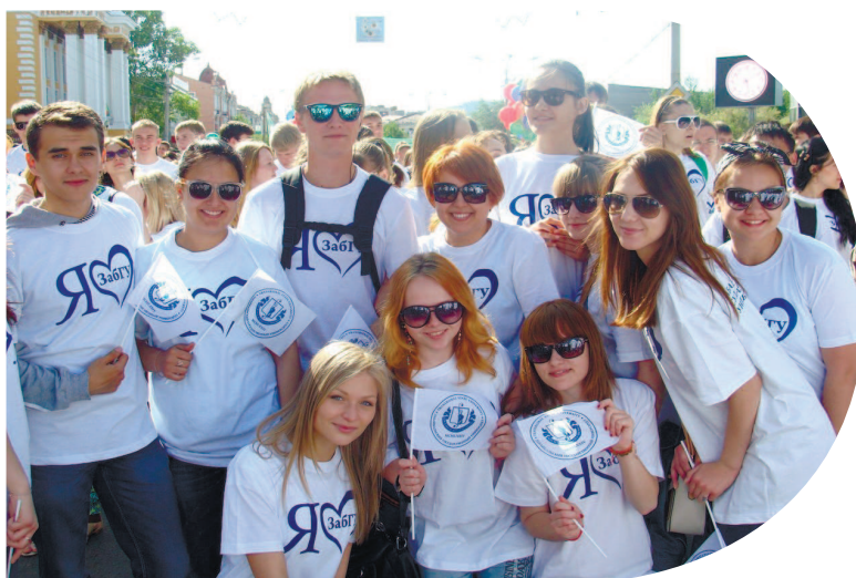
Студенты юрфака на традиционном шествии, посвященном Дню города. Наш университет всегда открывает колонну образовательных учреждений. И это заслуженная почётная привилегия!

Откройте дверь в мир актуальных знаний и ярких, позитивных студенческих лет вместе с юридическим факультетом Забайкальского государственного университета. Учитесь принимать решения!