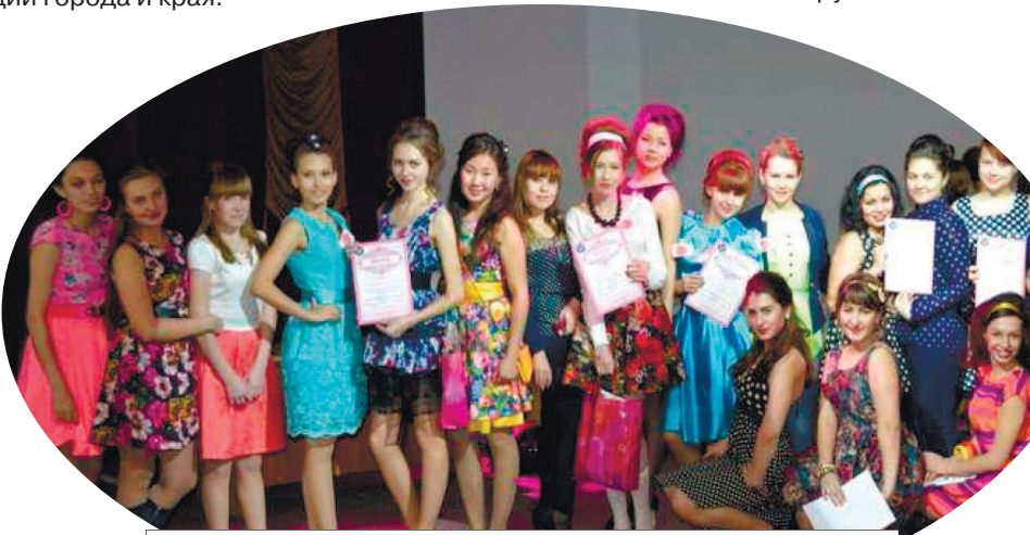
Студентки – участницы университетского конкурса парикмахерского искусства