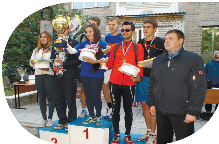
Студенты и преподаватели факультета – одни из лучших спортсменов университета. Много раз команда ФЕНМиТ становилась победителем спартакиады студентов, легкоатлетических эстафет и Дня здоровья ЗабГУ

Выпускники технолого-экономического направления являются востребованными в условиях рыночной экономики и готовы к мобильному выбору направления профессиональной деятельности, связанной не только с образованием, но и со сферой услуг и экономической деятельностью предприятий.