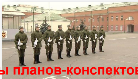
Варианты планов-конспектов занятий