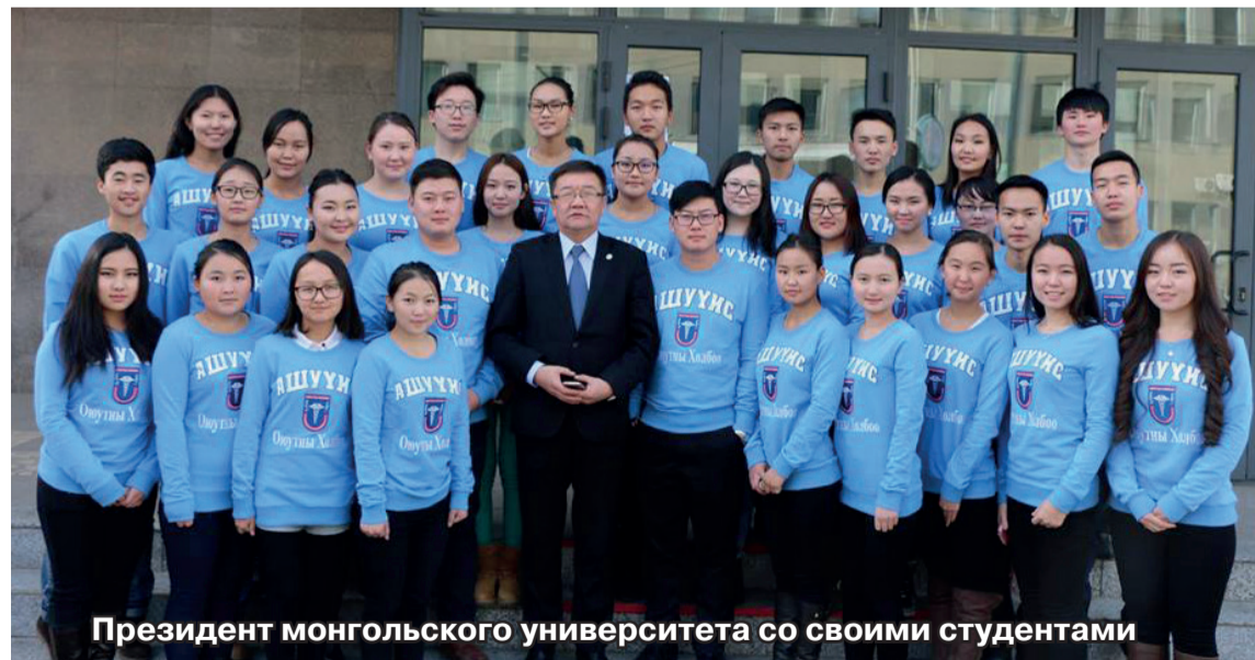
Президент монгольского университета со своими студентами

Монголия – загадочная страна, родина великого завоевателя Чингисхана. Её очень часто называют «Страной голубого неба». Это страна скалистых гор, озёр, бескрайних степей и пустыни Гоби. В Монголии есть прекрасные пейзажи, много буддийских храмов, и, конечно же, гостеприимные местные жители с самобытной уникальной культурой.