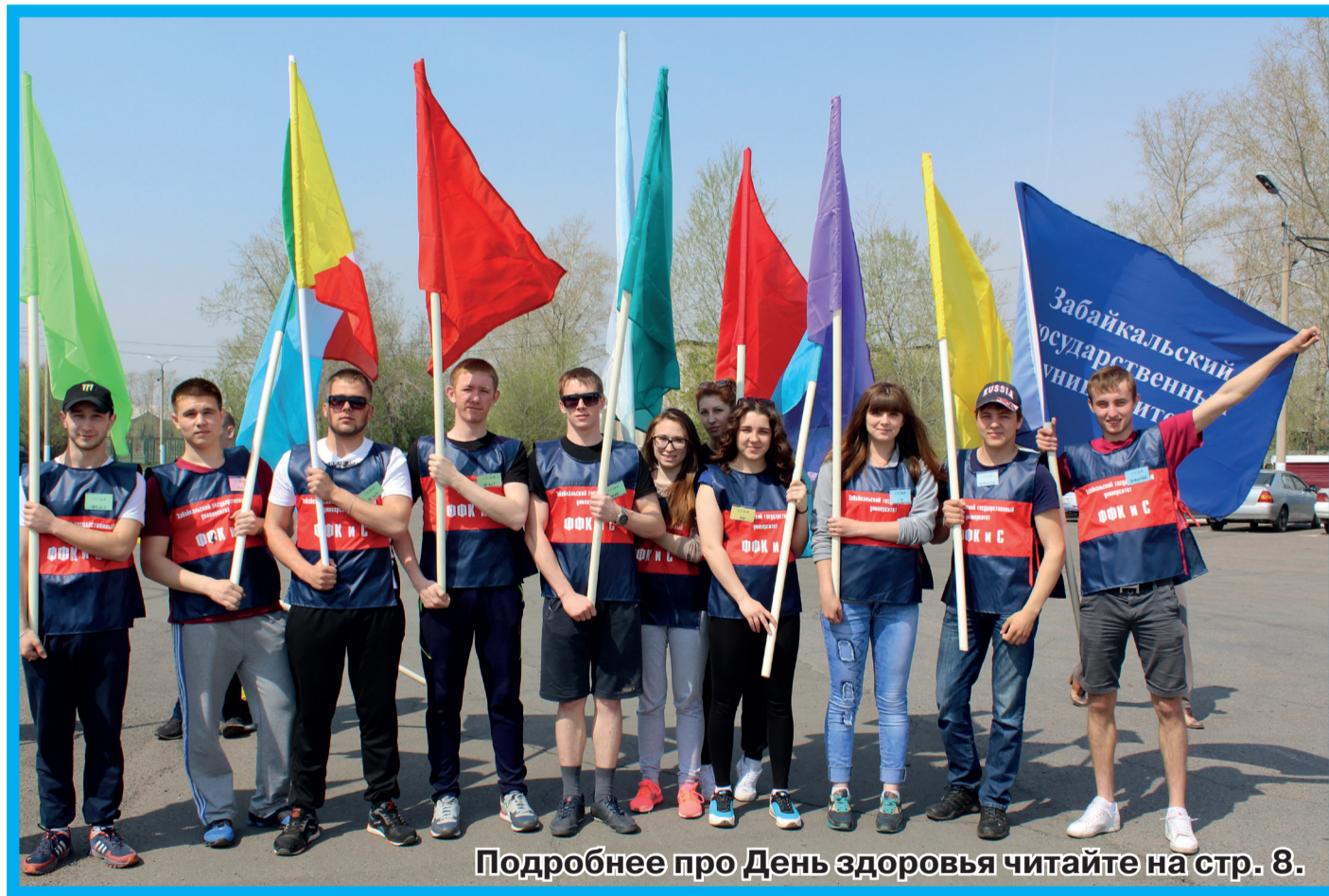
Подробнее про День здоровья читайте на стр. 8.

Самым продолжительным спортивным событием этого года стала Спартакиада студентов ЗабГУ. Победителем стал ФФКиС. Серебро — ФЭИУ, бронза — ФСиЭ. В рамках турнира прошли соревнования по: пулевой стрельбе, настольному теннису, гиревому спорту, волейболу, шахматам, бадминтону, мини-футболу, дартсу, плаванию, баскетболу, бильярдному спорту и легкой атлетике. На протяжении нескольких месяцев студенты зарабатывали очки для своих команд, чтобы вывести свой факультет на призовое место.