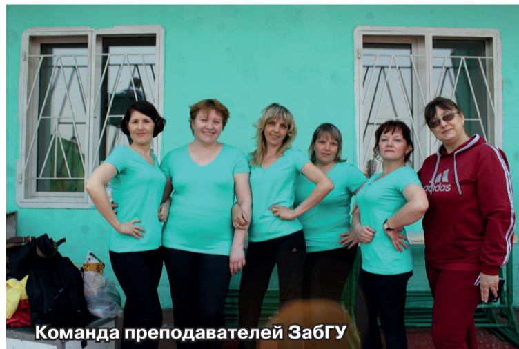
Команда преподавателей ЗабГУ

представляют свои команды в стиле черлидинга. В центре стадиона то и дело мелькают цветные костюмы, ленты и