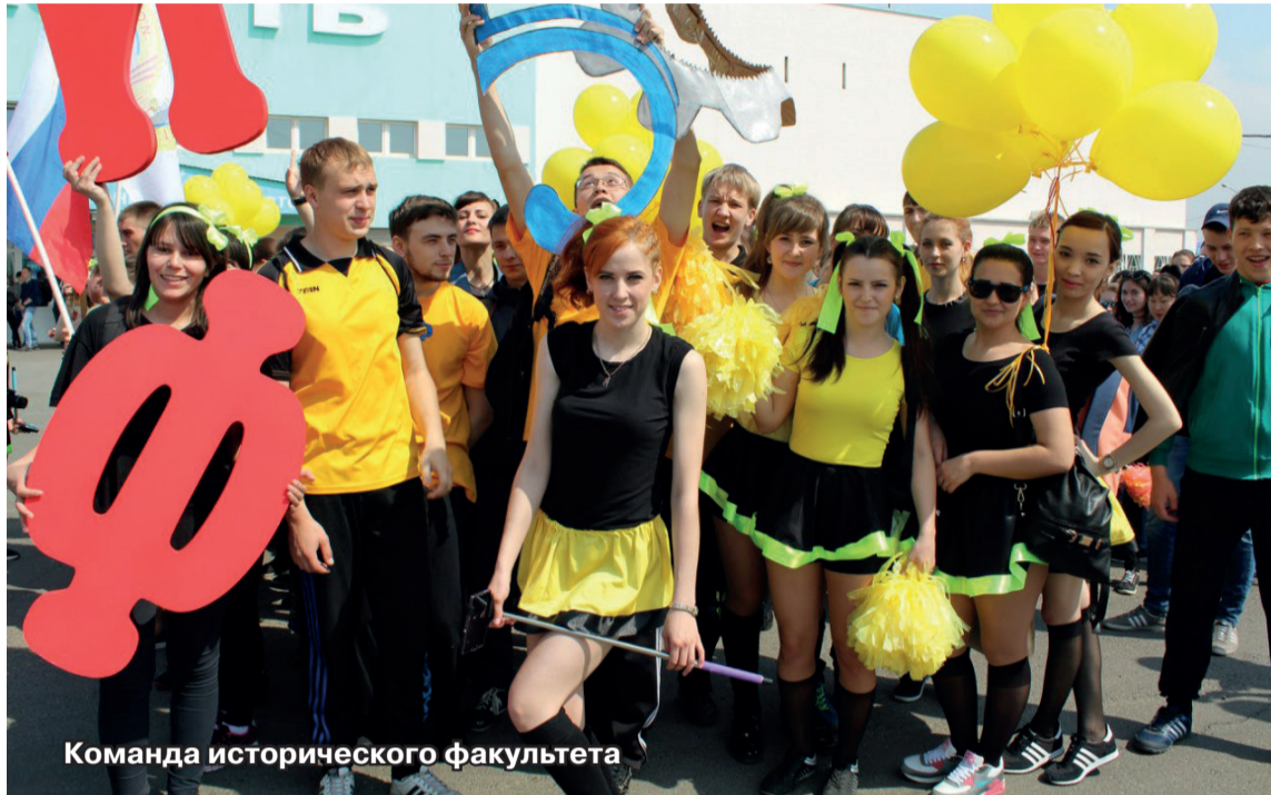
Команда исторического факультета

Яркие костюмы, воздушные шары, флаги и плакаты... Бесконечный поток людей движется на стадион «Юность», чтобы стать частью грандиозного события – Дня здоровья в ЗабГУ.