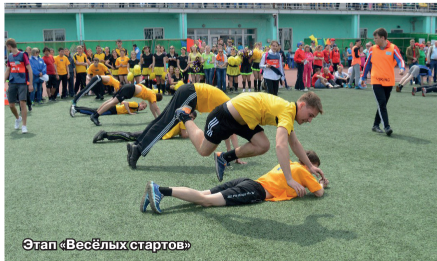
Этап «Весёлых стартов»

“УНИВЕРСИТЕТ” Газета для тех, кто учит и учится. Учредитель/Издатель: ФГБОУ ВПО «Забайкальский государственный университет». Свидетельство о регистрации СМИ от 24 апреля 2014 года ПИН № ТУ75-00193. При перепечатке ссылка на “УНИВЕРСИТЕТ” обязательна.