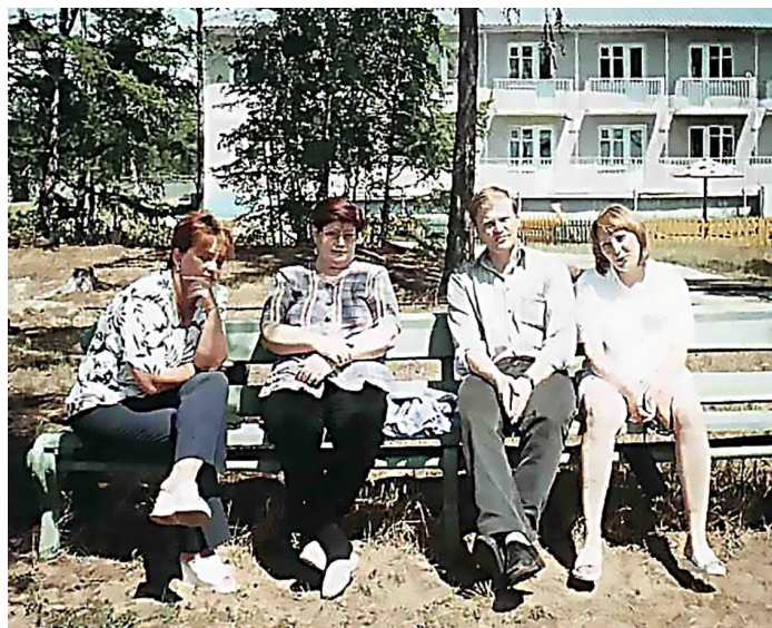
Первая Школа молодых ученых, оз. Арахлей, 2001 г.