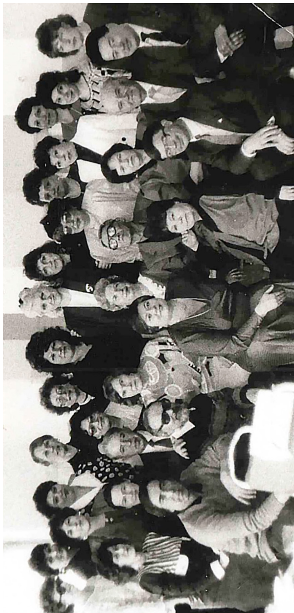
Встреча с однокурсниками, г. Чита, 1995 г.