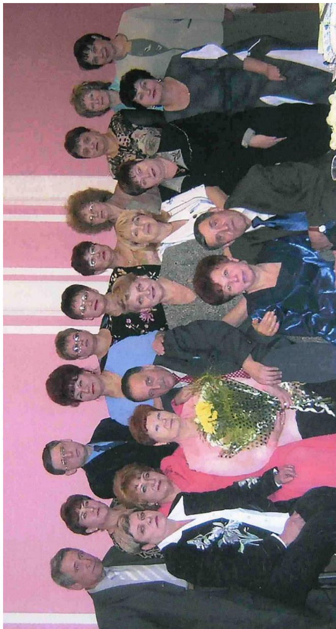
Встреча с однокурсниками исторического факультета, 2005 г.