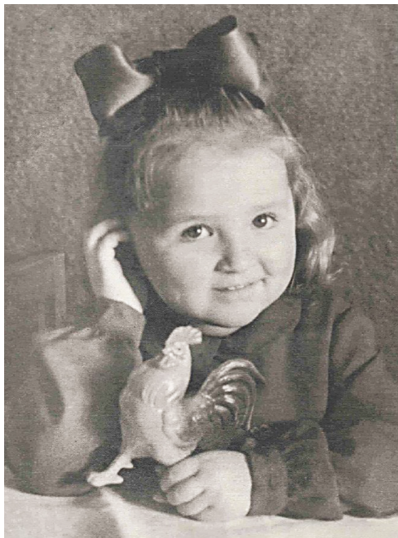
М. Б. Лига в детстве