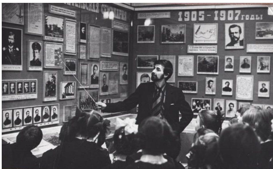
Урок в «Музее истории Читинской учительской семинарии» средней школы № 3 г. Читы