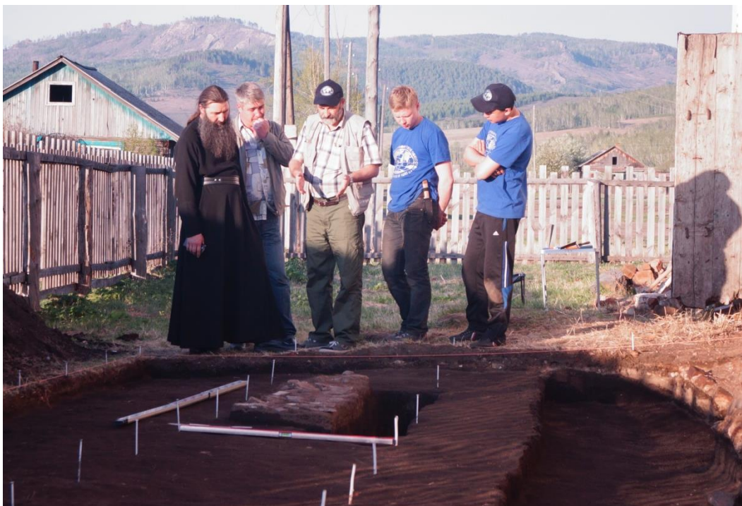
Изучение территории Успенской церкви в с. Калинино (до 1923 года Монастырское) Забайкальский край, Нерчинский район, 2015 год