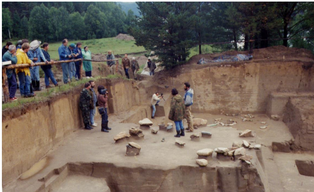
Демонстрация поселения Студеное-2 участникам Международной конференции 1996 год