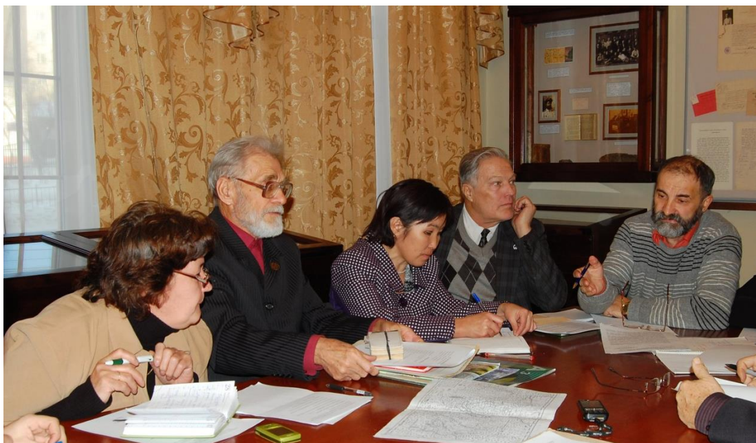
Заседание Забайкальского отделения Русского географического общества по проведению Всероссийского симпозиума «П.С. Паллас и его вклад в познание России» г. Чита, 2011 год