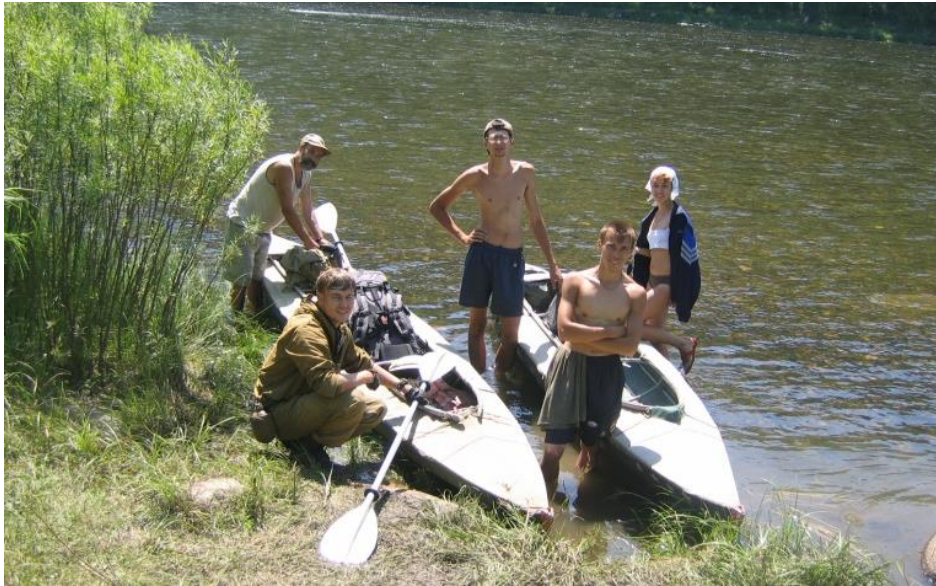
На байдарках по реке Мензе