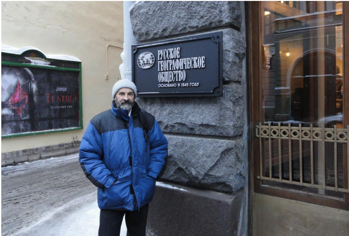
XIV съезд Русского географического общества г. Санкт-Петербург, 2010 год