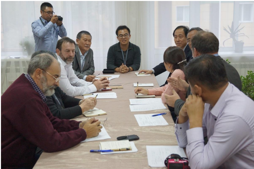
На заседании оргкомитета по проведению Международной конференции «Древние культуры Монголии и Байкальской Сибири» г. Красноярск, 2016 год