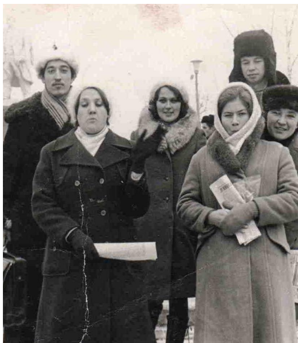
5 курс ЧГПИ и.м. Н.Г. Чернышевского, 1975 г.