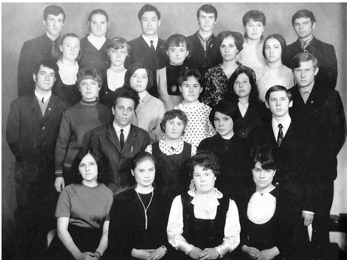
1 курс ЧГПИ им. Н.Г. Чернышевского, 1972 г. ( в первом ряду, вторая слева)