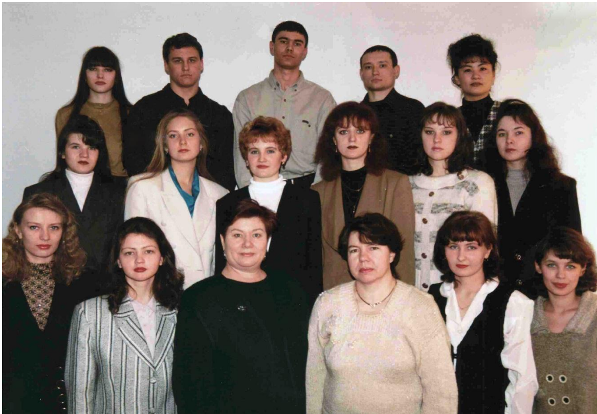
Первый выпуск студентов по специальности «Социальная работа», социально-психологический факультет, 1999г.