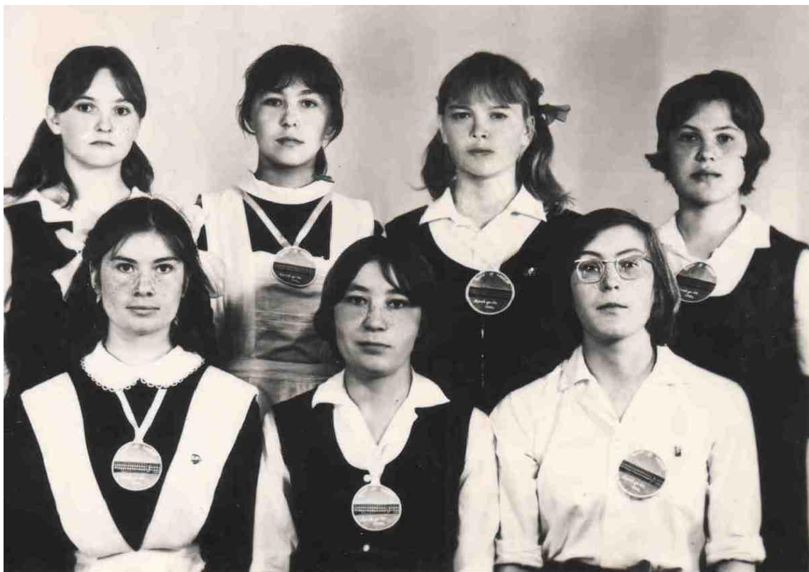
Последний звонок, май 1970 г.