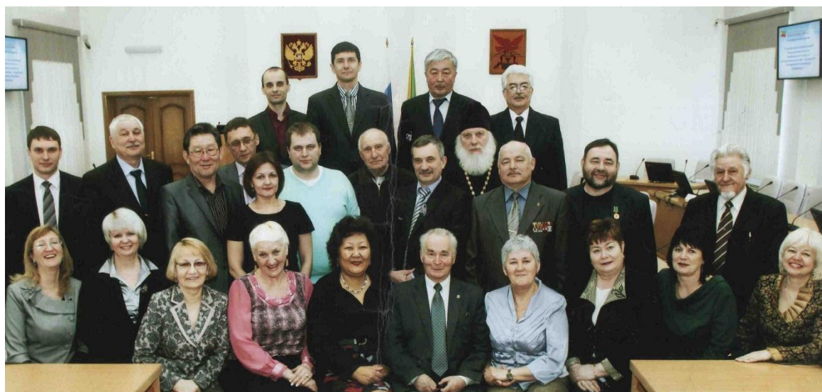
Общественная палата Забайкальского края, первый созыв, 2014 г.