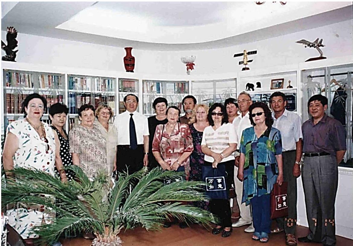
г. Хайлар, Хулунбуирский университет, с профессорами Сибири и Дальнего Востока