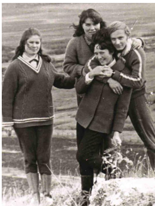
На практике в Нерчинский заводе, 1974 г.