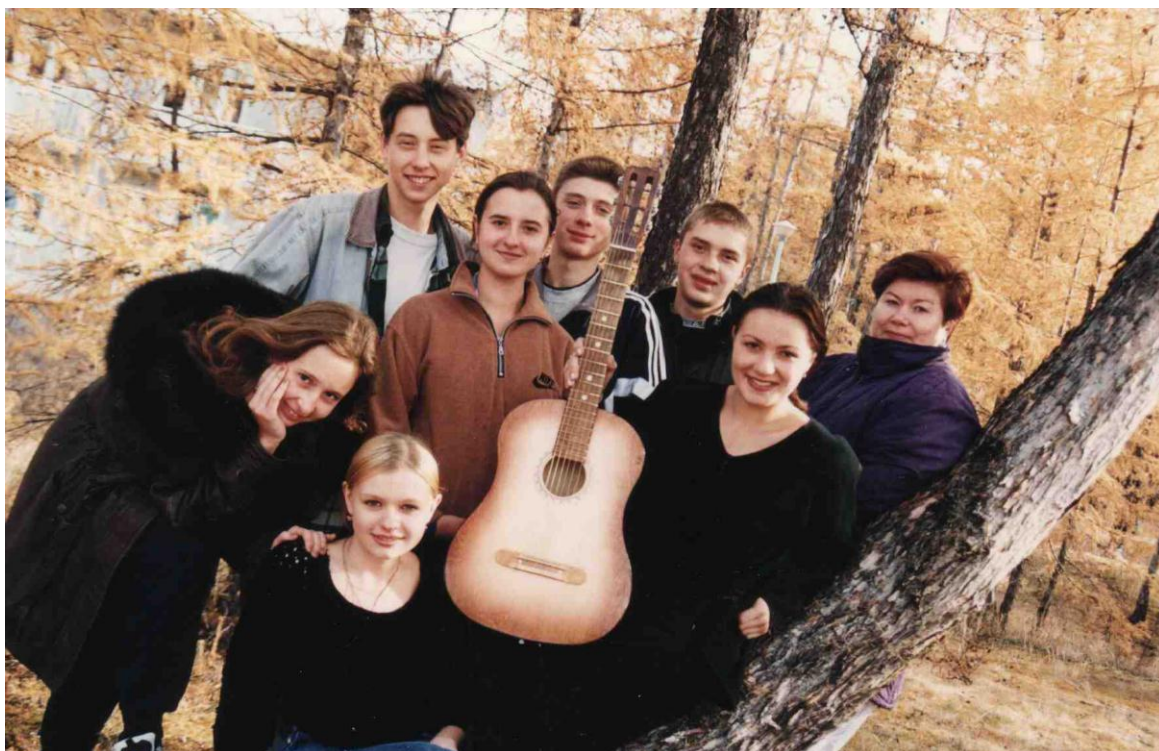
С выпускниками Лицея на оз. Арахлей, 1997 г.