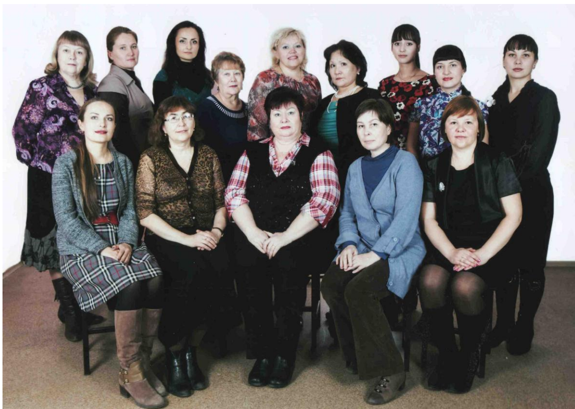
Коллектив кафедры педагогики ЗабГУ, 2013 г.