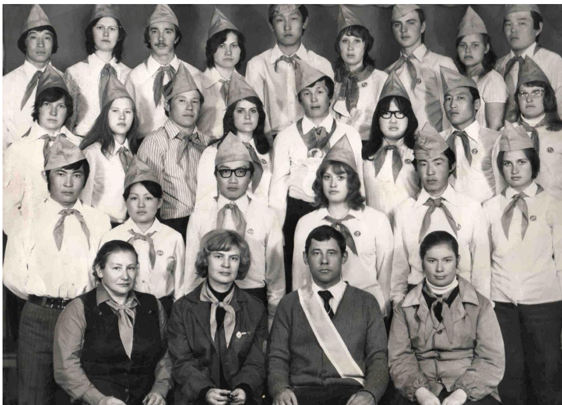
Вожатские лагерные сборы, лагерь «Ракета», физмат 1978 г.