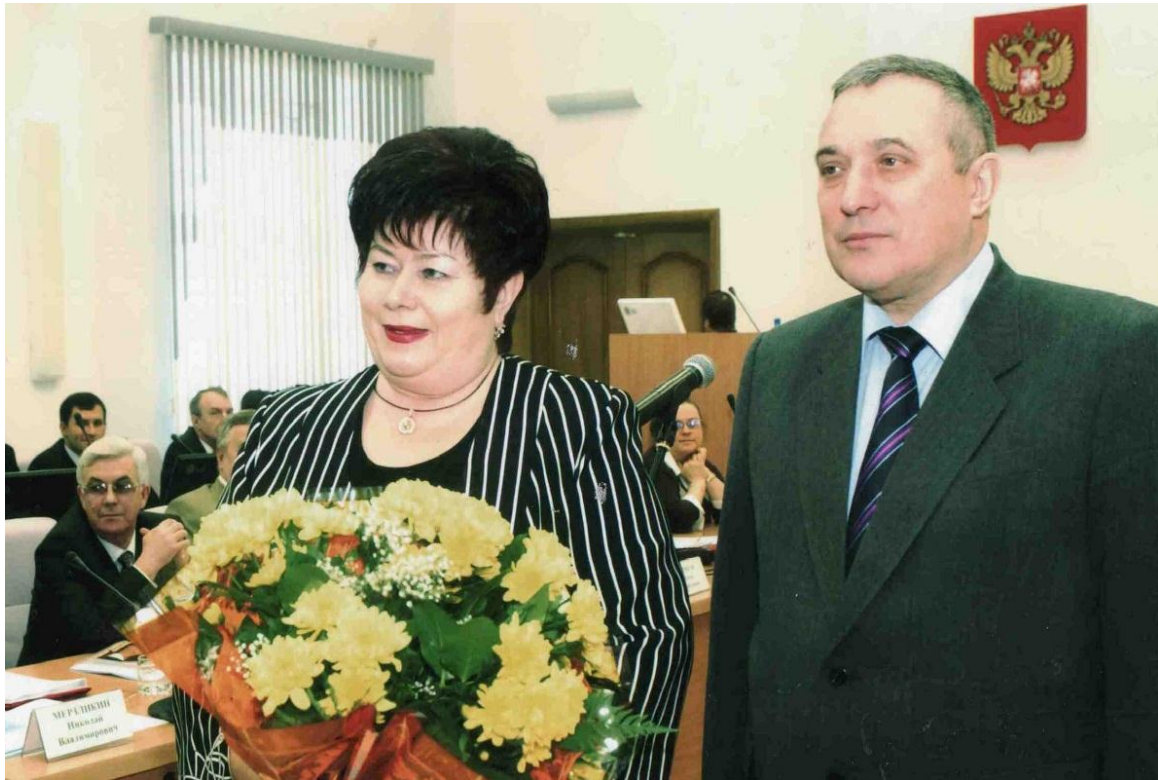
Татьяна Клименко с Анатолием Васильевичем Квашиным, полпредом Президента РФ в СФО, вручение государственных наград, Администрация Читинской области, г. Чита, 5 февраля 2008 г.