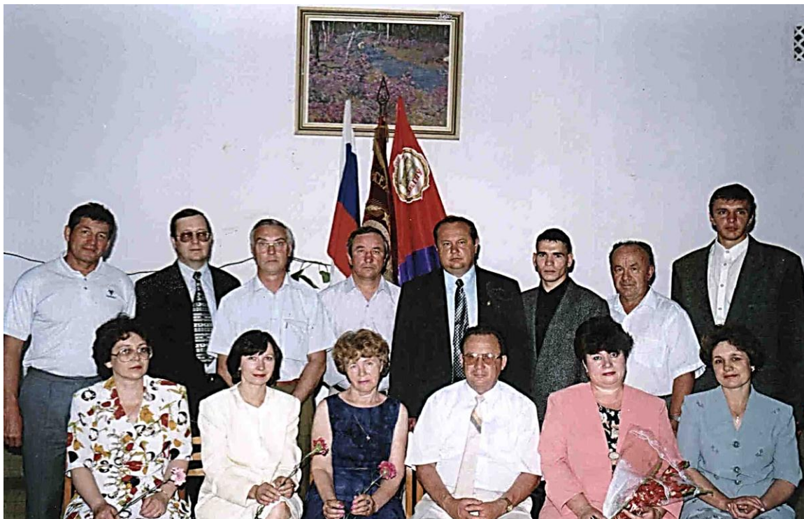
Совещание деканов ЗабГПУ им. Н.Г. Чернышевского, г. Чита, 1998 г.