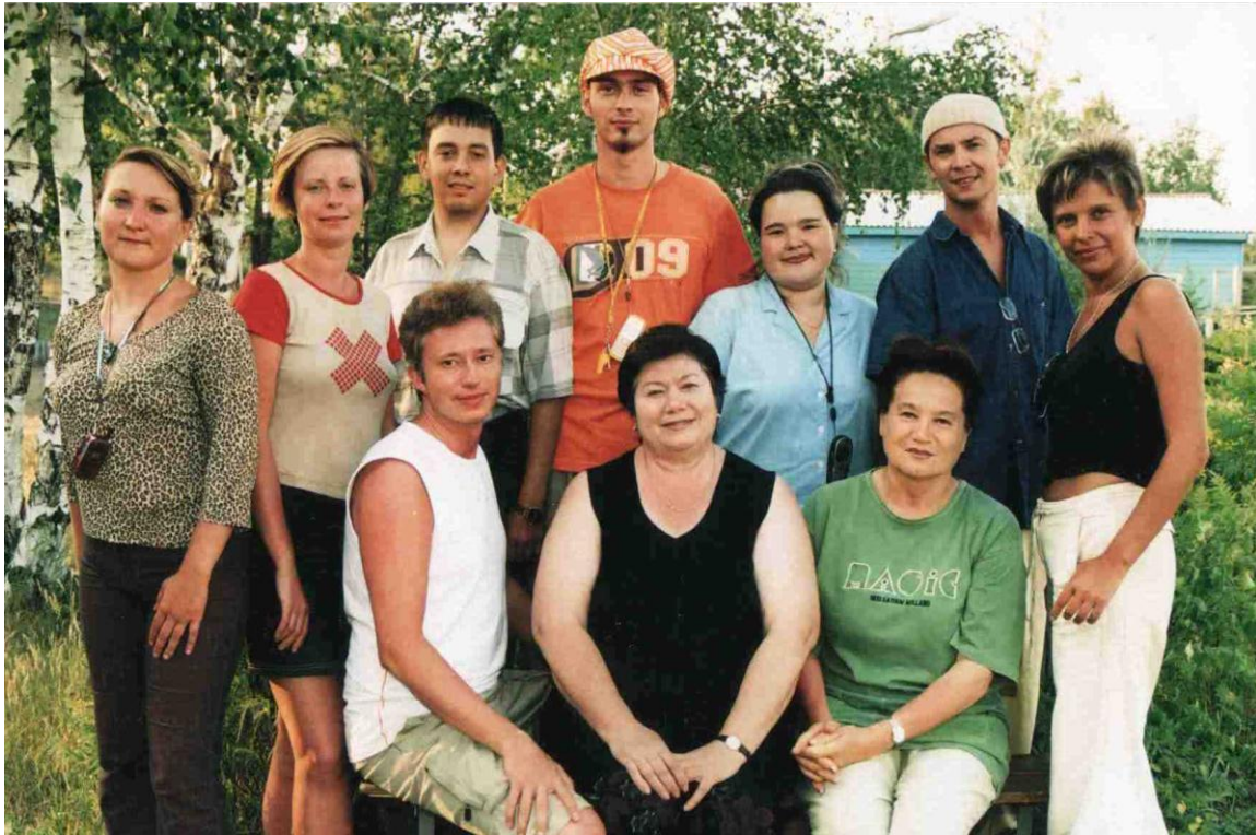
Школа молодых ученых, педагогов-исследователей и лидеров молодежной политики, штаб школы оз.Арахлей, 2003 г.