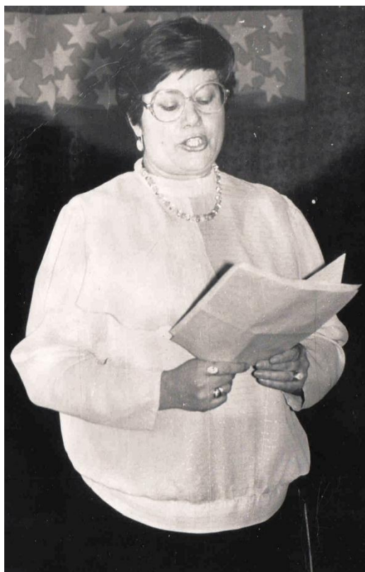
На конференции ЧГПИ им. Н.Г. Чернышевского, 1989 г.