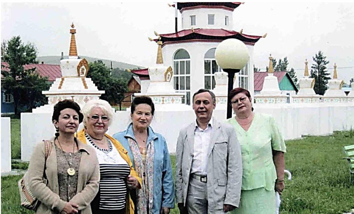
п. Агинское Забайкальского края, открытие Агинского медицинского колледжа, с коллегами Комитета образования, 2006 г.