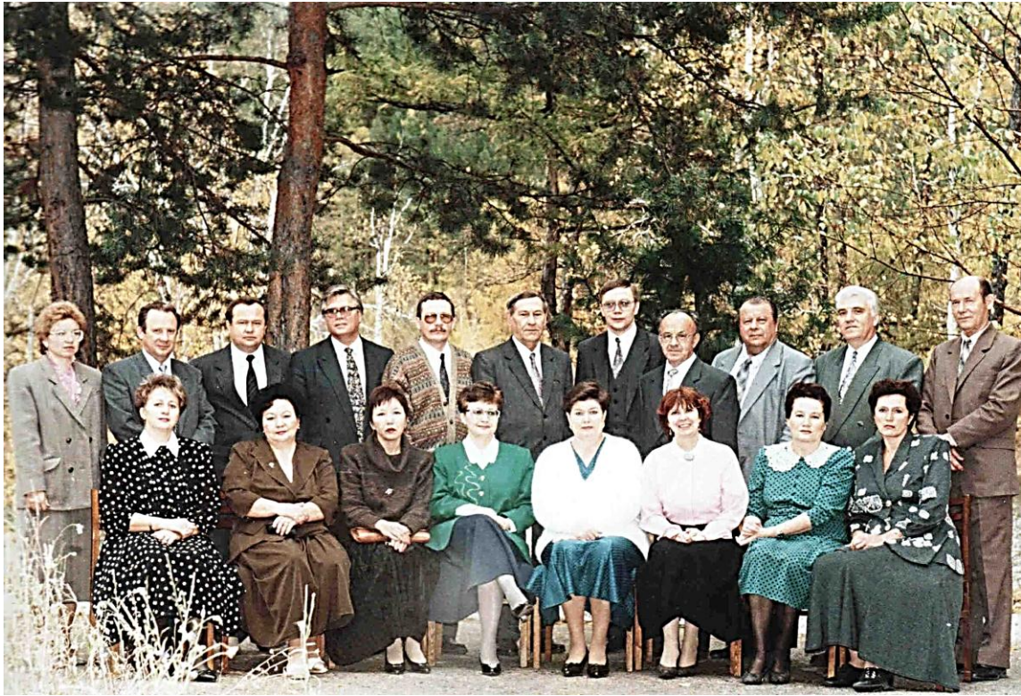
Советов ректоров Дальнего Востока, г. Чита, курорт Молоковка, 1996 г.