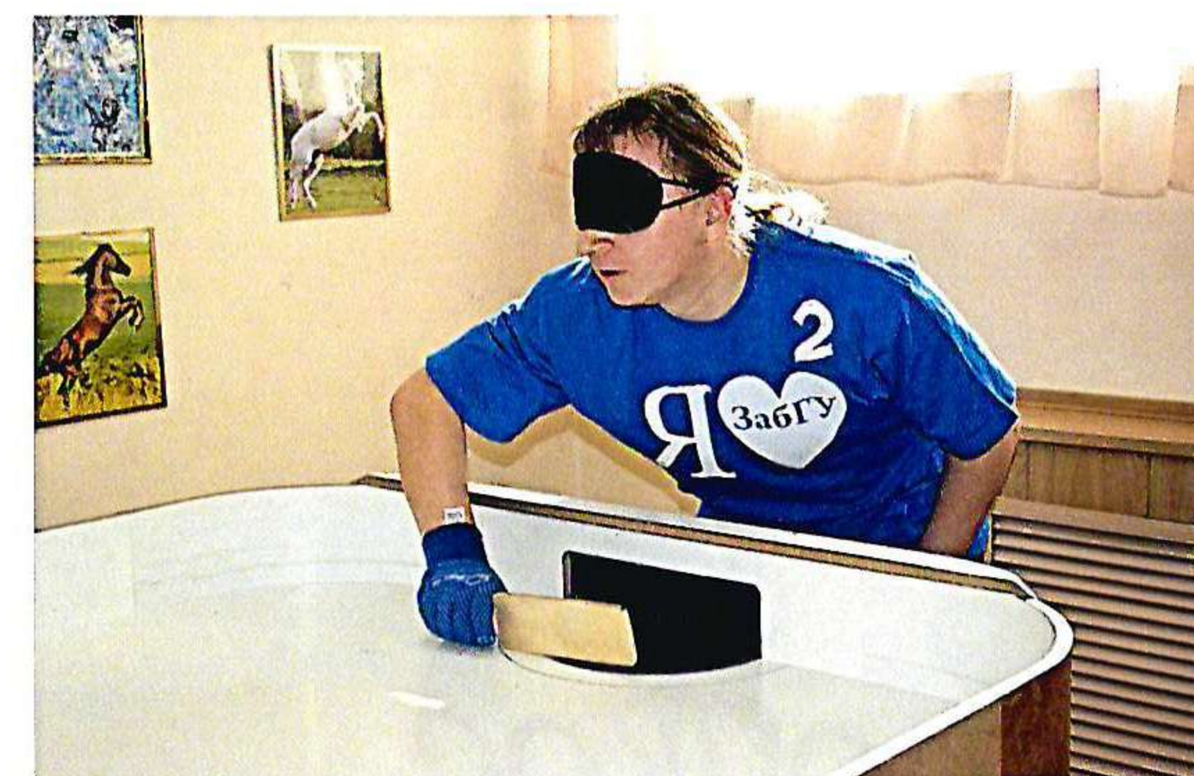
Открытый Кубок ЗабГУ по игре «Showdown»