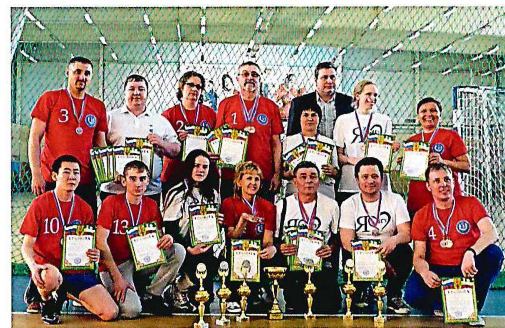
Интегрированный турнир по паралимпийским играм на Кубок Ректора ЗабГУ «Инклюзив-спорт»