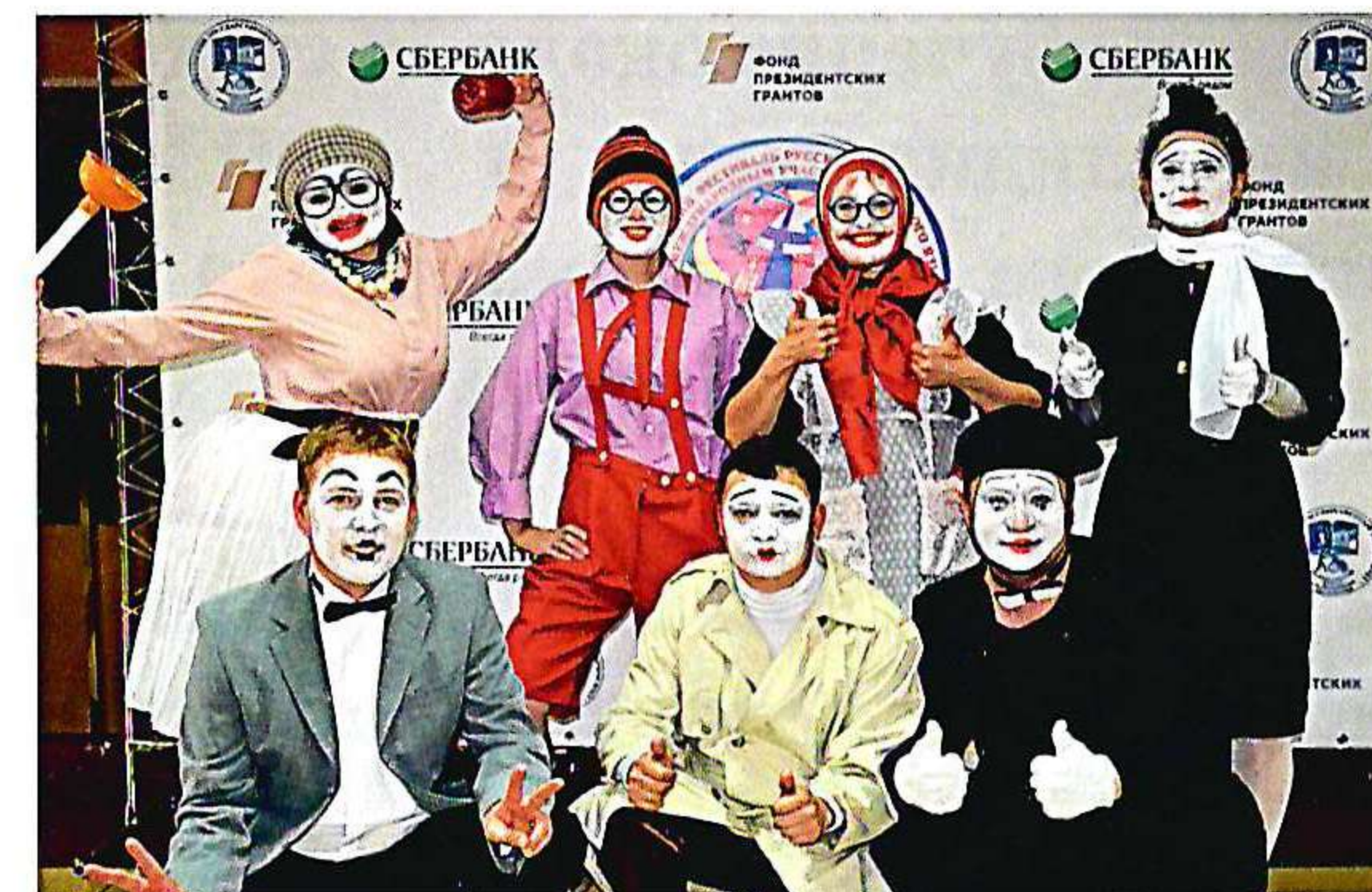
Всероссийский фестиваль русского жестового языка «Мы слышим друг друга»