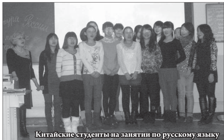
Китайские студенты на занятии по русскому языку

Значение дисциплины «Фильмы России» занимает важное место в нашем обучении наряду с другими предметами.