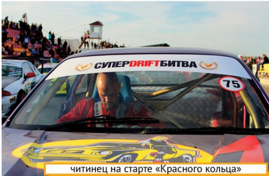
«читинец на старте «Красного кольца»»

Почти каждый мальчишка, а иногда и девчонка, представляет себя за рулём автомобиля. У кого-то в мечтах трудяга-грузовик, у кого-то – роскошный кабриолет, а некоторые хотят, «как папа», возить семью на отдых к озеру. Но мы обратим внимание на тех, кто уже в юности понимает, как пленительно единение с автомобилем, как сильны эмоции, которые получаешь от контроля над машиной.