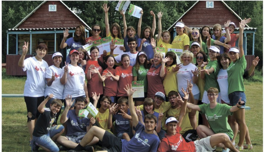
на фото: участники «Школы лидерства - 2014»

Подозрительная гипотеза: школы актива дают участникам заряд на работу в студенческом самоуправлении, которого хватает на пару месяцев.