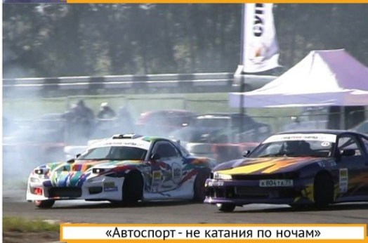
«Автоспорт - не катания по ночам»