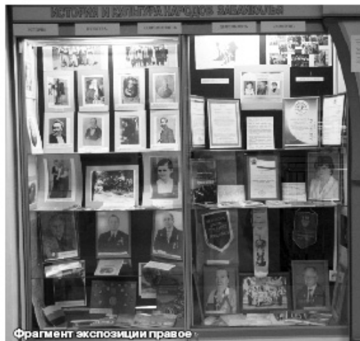
Фрагмент экспозиции правее