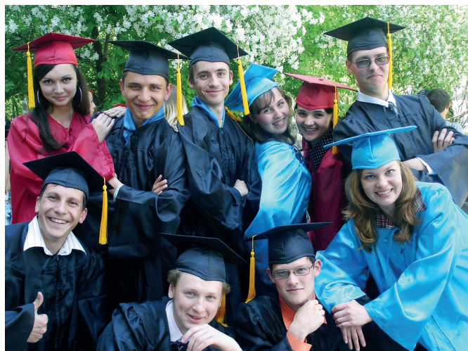
Представители Университетского студенческого совета ЗабГГПУ, 2007 год

До избрания в 2016 году в Государственную Думу РФ работал руководителем фракции ЛДПР в Заксобрании края. Вошёл в комитет ГД по федеративному устройству и вопросам местного самоуправления.